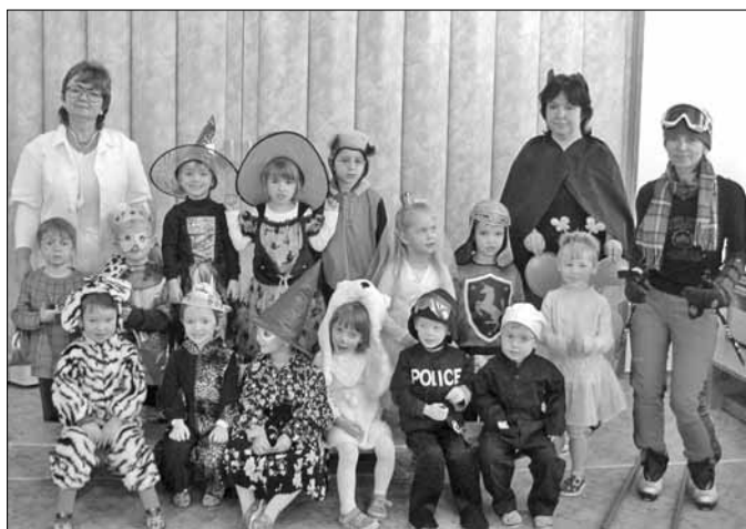
■ Pohádkový den