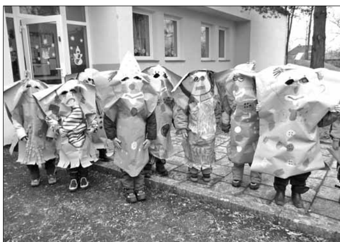
■ Masopust - poznáte nás?