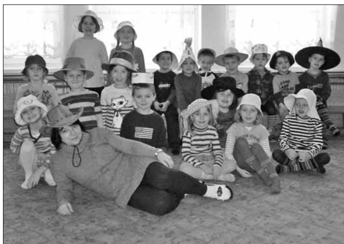
■ Kloboukový den