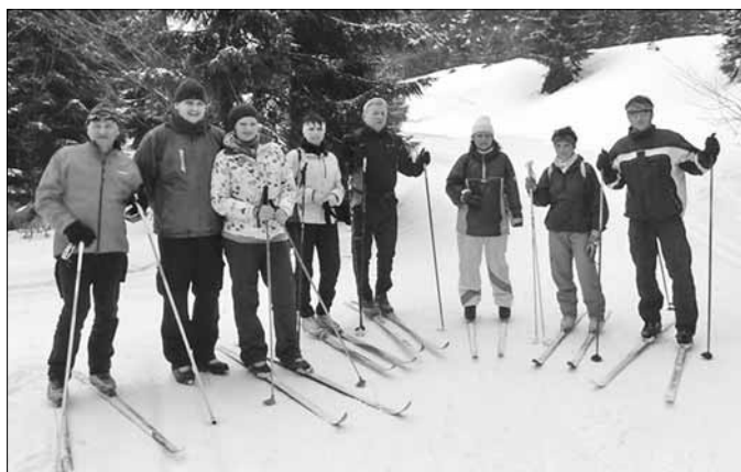
■ Zimní zájezd hasičů

Lyžaři – sjezdaři se proháněli - na tuto dobu – po celkem kvalitně upravených sjezdovkách různých obtížností. Zejména sjezdovka Valachovka se sedačkovou lanovou dráhou na Studený vrch (874m n.m.) poskytla prima lyžovačku a k tomu i nádherný výhled na okolní krajinu. Lyžaři - běžkaři si úchvatných panoramat užili ještě více při 20km túře směrem na Šerlich přes oběd na Masarykově chatě, směrem na Bukačku a Sedloňovský vrch. Za zmínku stojí také fakt, že nejstaršímu lyžaři našeho zájezdu bylo téměř 70 let a i přesto si tento den s ostatními aktivně užil.