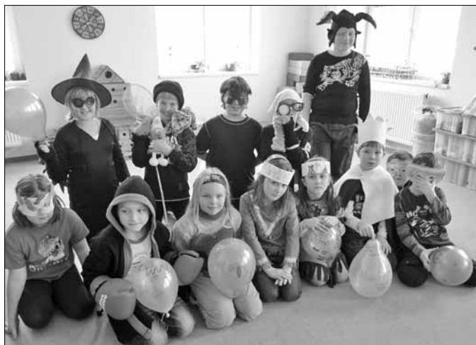
■ Karneval ve školní družině

Čtvrtek 2.2.2012 se stal velmi důležitým dnem pro místní předškoláky. Se svými rodiči a některými i sourozenci přišli k zápisu do 1. ročníku. Nejprve je přivítaly a školou provedly pohádkové bytosti. Potom se představili ředitelce školy a řekli jí něco o sobě. Poté si šli popovídat s některou z učitelek a ukázat jí, co všechno umějí. Za to byli zapsáni