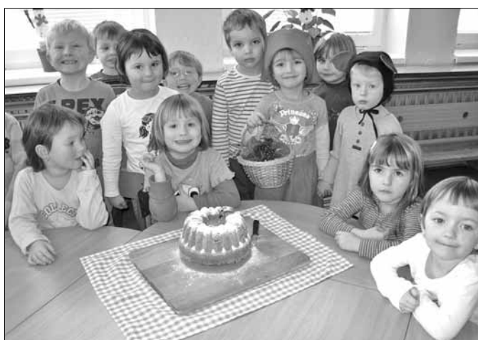
■ V mateřské škole