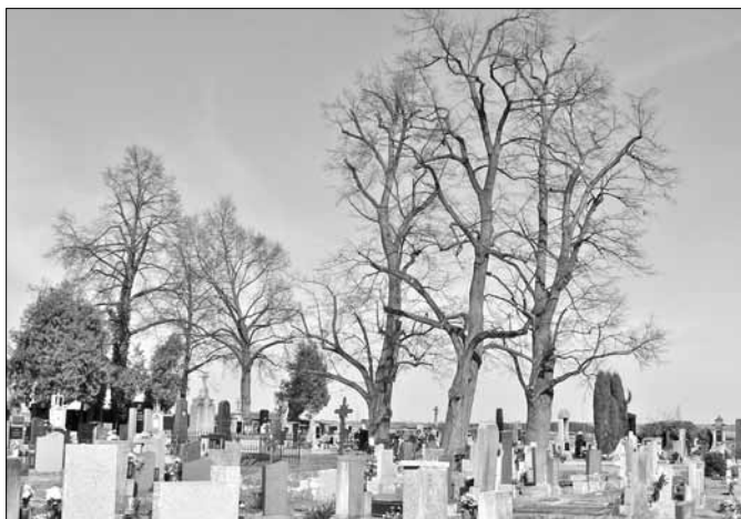
■ Údržba zeleně