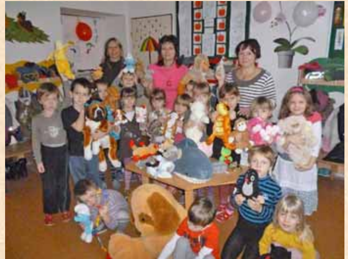
■ Plyšákový den