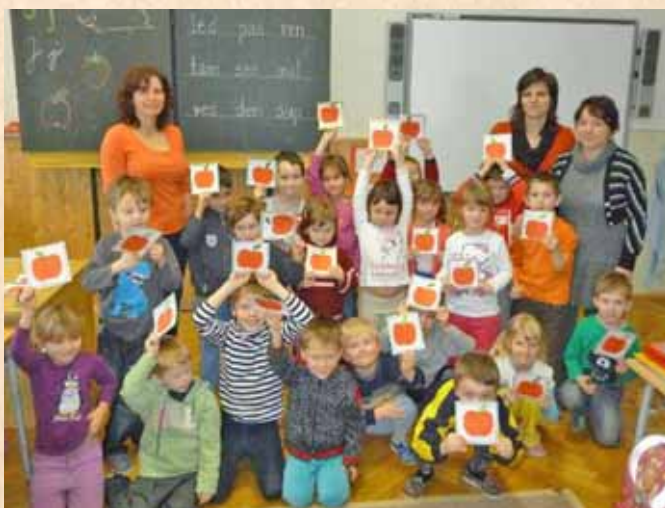
■ Ve škole