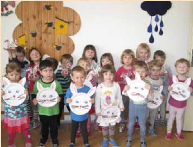
■ Tvoření - zajíčci