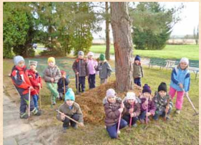
■ Na zahradě