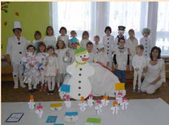
■ Sněhulákový den