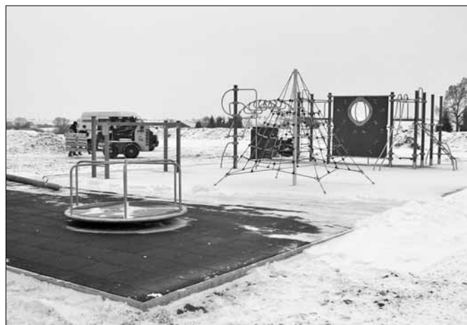
■ Dětské hřiště